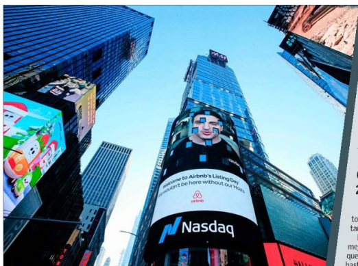
Las acciones abrieron a US$ 146 en el Nasdaq, muy por sobre el precio de la Oferta Pública Inicial (OPI) de US$ 68. El papel alcanzó un máximo de US$ 165.

Con US$ 146 por acción, Airbnb tenía una capitalización de mercado de alrededor de US$ 87.200 millones, en comparación con los US$ 86.300 millones de Booking Holdings y los US$ 42.300 millones