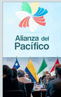
Uno de los ejes de la gestión de Chile fue impulsar el avance institucional del bloque.

Yáñez caracteriza esta cumbre como un relanzamiento de la Alianza, con cohesión y espíritu de generar resultados.